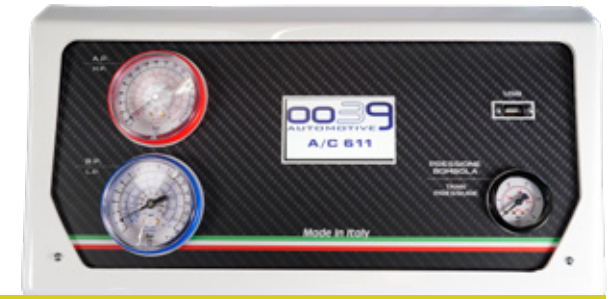
La certezza del Made in Italy