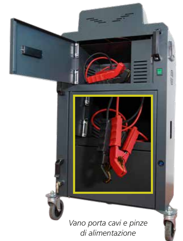
Vano porta cavi e pinze di alimentazione