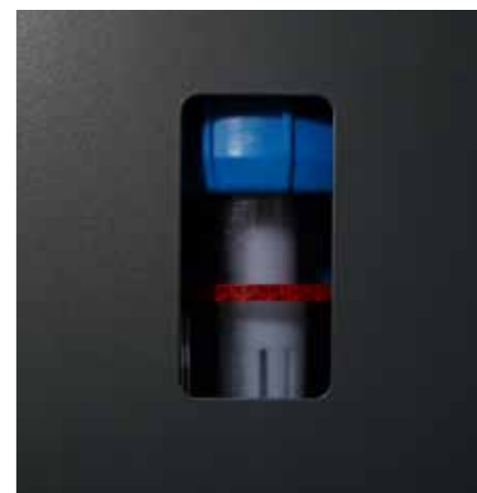
Particolare del gorgogliatore di sicurezza interno visibile attraverso l'apertura laterale dello chassis.

Kit di avvio per la produzione di ossidrogeno composto da un elettrolita (idrossido di potassio) e acqua demineralizzata.