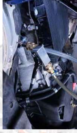
Esempio di collegamento al veicolo dei tubi olio della stazione lavacambi mediante raccordi dedicati