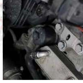
Dettaglio sul filtro dell'impianto di trasmissione di un cambio DSG

Il database delle stazioni lavacambi della serie 600 fornisce una guida completa passo dopo passo sul corretto procedimento di manutenzione, indicando tutti i parametri e le fasi di lavorazione come i codici originali dei ricambi o i valori delle coppie di serraggio delle viti.